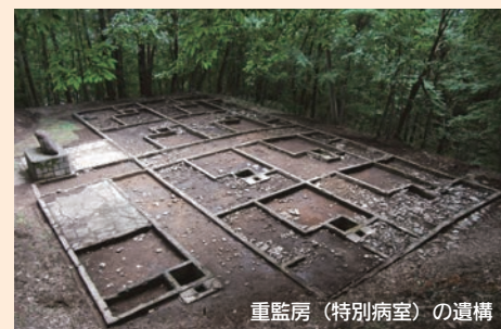
重監房（特別病室）の遺構

重監房（特別病室）の収監に関しては、その運用や手続きなど未だに不明な点が多くあります。重監房資料館は、こうした重監房とハンセン病問題に関する資料の収集・保存と調査・研究の成果を発表することにより、人の命の大切さを学び、広くハンセン病問題への理解を促すことで、ハンセン病をめぐる差別と偏見の解消を目指す活動をしています。