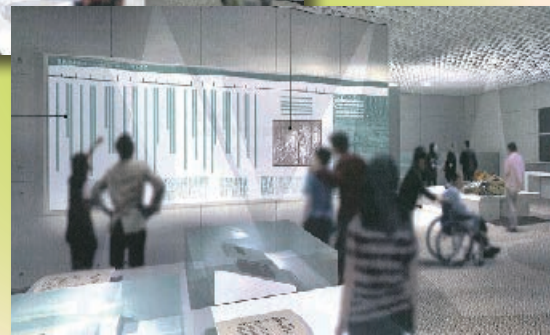
歴史コーナー(イメージ)

展示室には、重監房(特別病室)の一部を実寸大で再現したスペースがあり、再現映像や20分の1の縮尺模型をご覧いただけます。