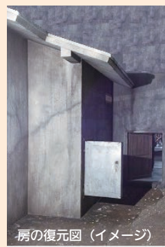
房の復元図（イメージ）

当館は、重監房（特別病室）を負の遺産として後世に伝え、ハンセン病をめぐる差別と偏見の解消を目指す普及啓発の拠点として、人権尊重の精神を育みます。