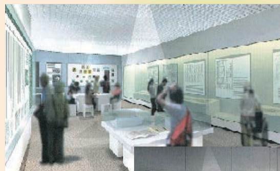
発掘調査出土遺物コーナー(イメージ)